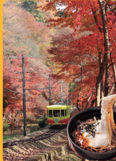
Hachioji Marugoto Sightseeing Guide