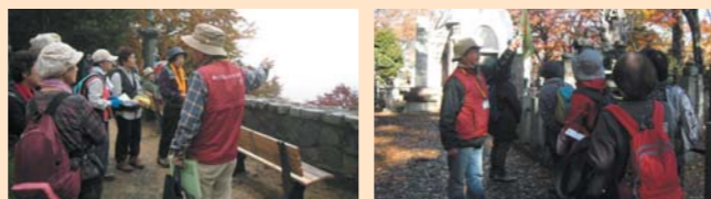
見どころガイド活動風景

初めて高尾山を訪れる方々にも、解りやすい解説でリピーターが増加しています。これからも講師の研修や自主研修を行い、高尾山をより安全に楽しくご案内できるように努めていきます。