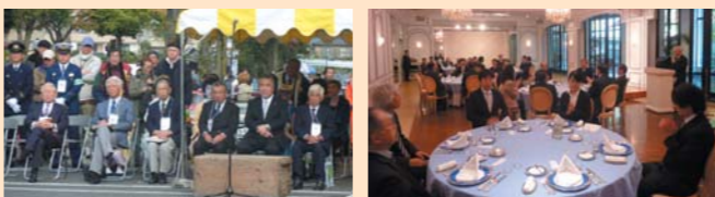
クラシックカーパレード出発式 懇親会

11月16日(日)の「八王子いちょう祭り」に小田原市副市長・寄居町町長・小田原市観光協会副会長・寄居町観光協会会長をはじめ両市町の方々にお越しいただきました。当日は鮮やかに黄葉したイチョウ並木をクラシックカーパレードのオープンカーやボンネットバスへご乗車いただいた後、祭りを見学していただくなどさらに交流を深めました。また、小田原市・寄居町には「物産・観光展in八王子」へご出店もいただきました。