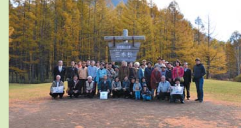
日光国立公園戦場ヶ原