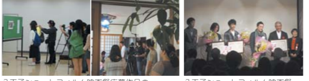
八王子ショートフィルム映画祭応募作品の撮影風景 八王子ショートフィルム映画祭

映画、テレビドラマ、バラエティなどの撮影、そしてエキストラボランティア派遣などの撮影支援を行い、平成17年に発足してから9年が経過しました。 昨年の夏から冬にかけては、TBSドラマ「女はそれを許さない」、NHK特集ドラマ「紅雲珈琲屋こよみ〜帰ってきた男〜」、映画「イニシエーション・ラブ」、「図書館戦争2」などの支援をはじめ、バラエティ番組の日本テレビ「心ゆきふれ!先輩ROCK YOU」、「幸せ!ボンビーガール」や、小学館雑誌スチール写真「ドラえもん TOKYO JIKAN」など、幅広く支援させていただきました。 また、実行委員でもある八王子ショートフィルム映画祭では、応募作品7作品のうち、5作品の撮影支援、およびエキストラ派遣を行いました。11月30日(日)に行われた映画祭では、支援した作品がグランプリ、準グランプリ、日本閣特別賞を受賞いたしました。 今後も制作会社からの多種多様な要望に応えるため、会員の皆様へ撮影場所の提供をご相談させていただくことがあるかもしれません。会社、商店、団体、また地域のPRとしてご協力いただけますようお願いいたします。